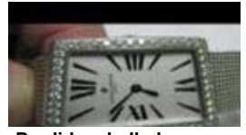
Perdido y hallado