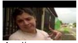
Agresión a discapacitada

see all 24 videos > | collect with vodpod